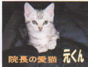
院長の愛猫 元くん