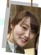
Illustration by nifran

札幌を離れての生活になりますが、すずき歯科で学んだことをいかし、今後もまた新たな環境で歯科衛生士としても、人としても日々成長していきたいと思っております。