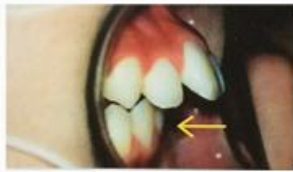
歯並びが歪んでしまいました