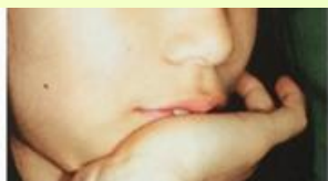
下顎が下がり出っ歯に見えます