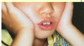
歯並びが歪んでしまいました